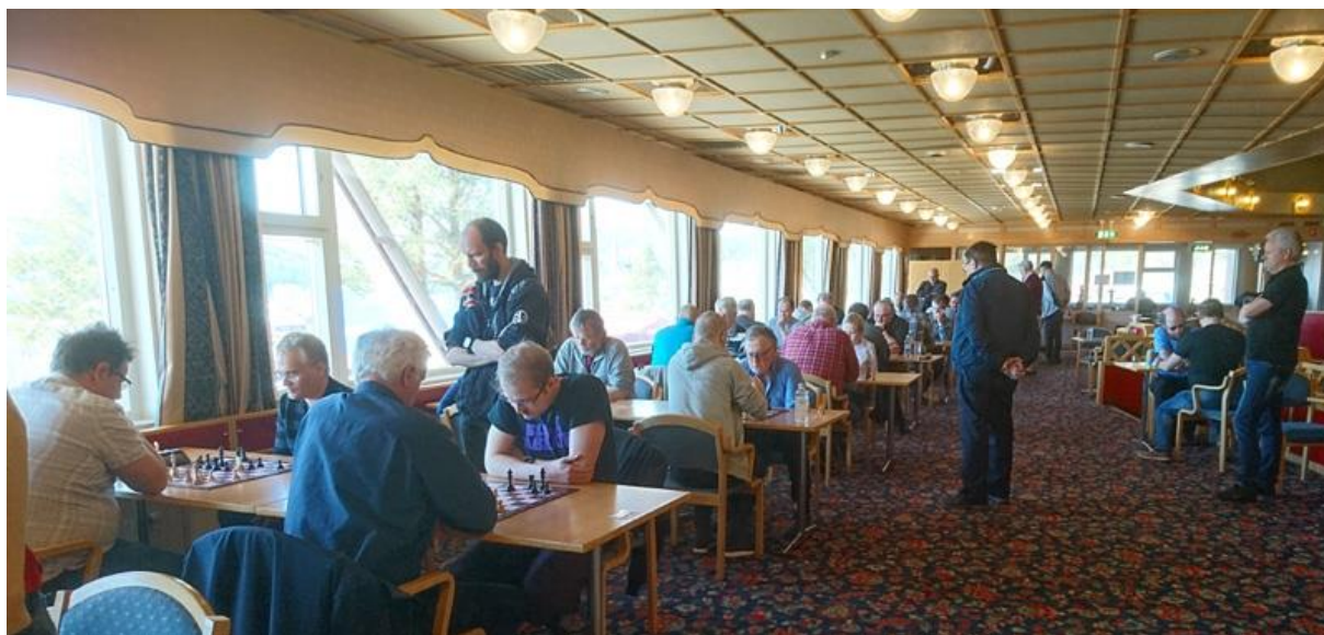
Frukt på Jobbet Open