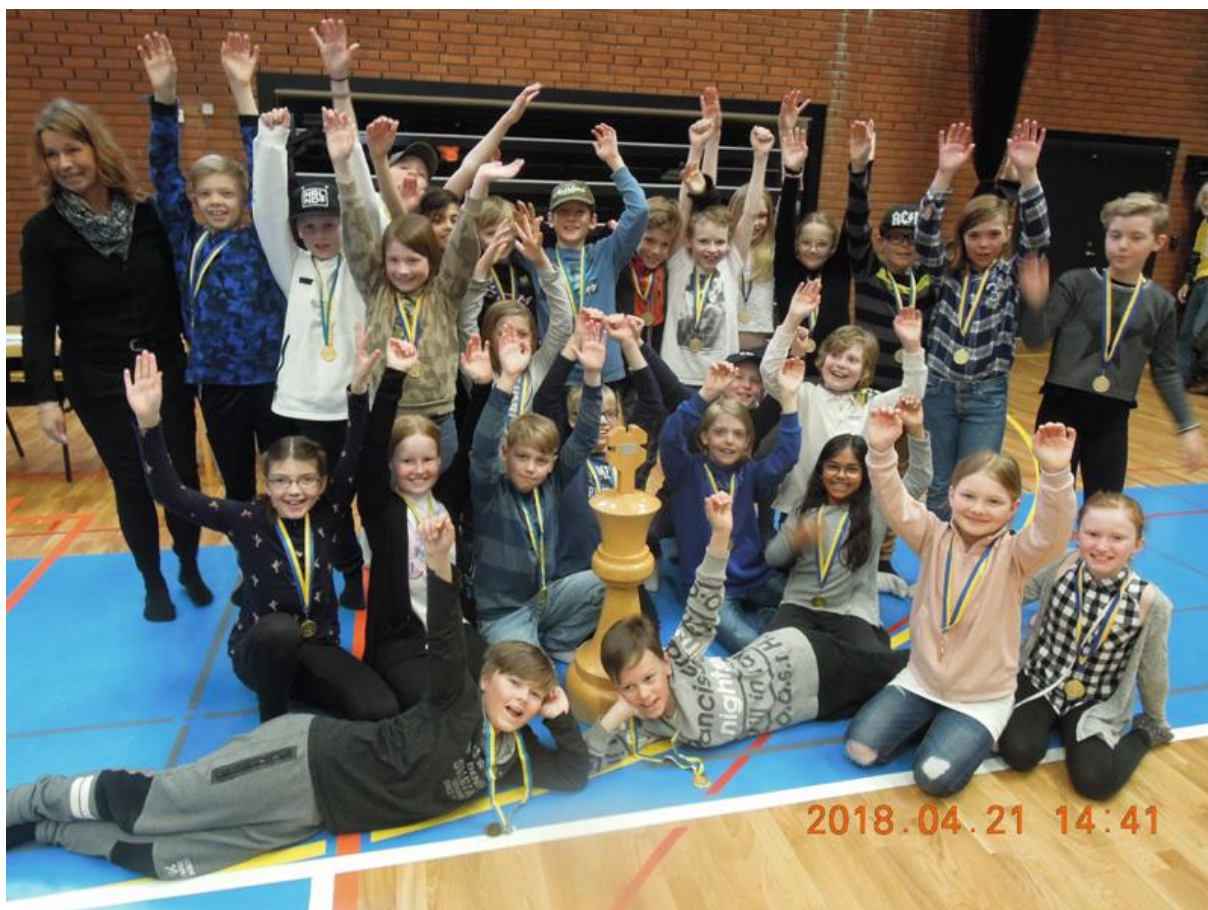
Segrande i Länskvalet av Schack4an: Sånghusvallens skola