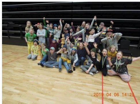
Ett antal prisbelönade elever från Stamgårdeskolan

Lagpriset för Sexorna – ett vandringpris i form av stor trälöpare – gick till Hotings centralskola, 48 poäng, följd av Stamgårde skola, 12 poäng.