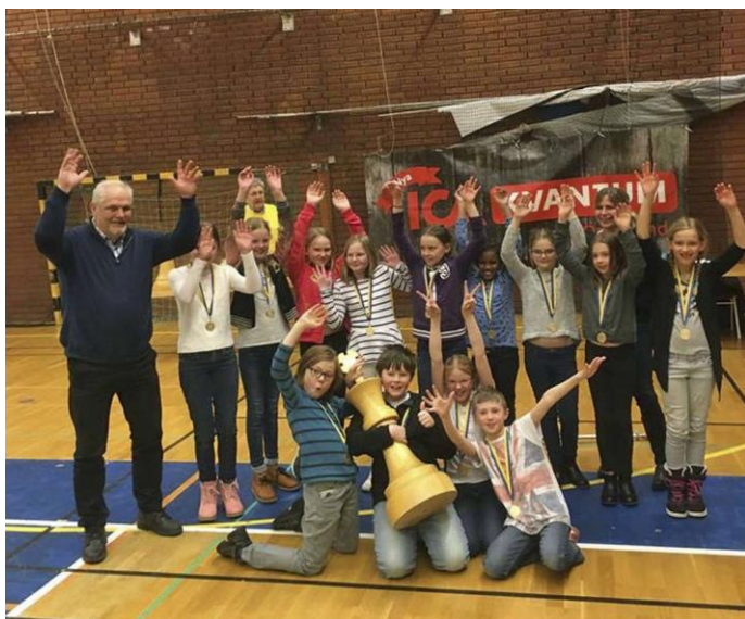
foto: vinnande Sonfjällsskolan,Hede

De fyra främsta lagen kvalificerade för riksfinalen i Västerås där Norra skolan kom på fjärde och Sonfjällsskolan på en hedrande femteplats (av 128 finallag).