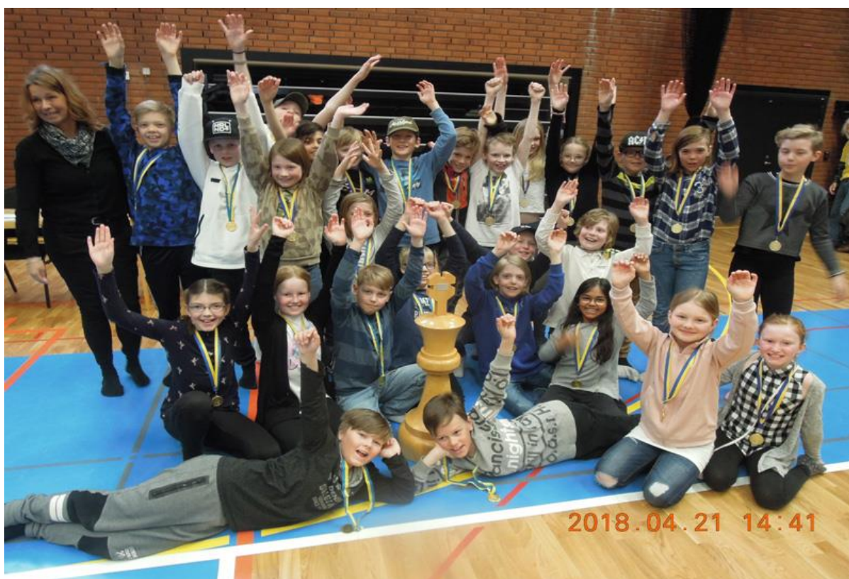
Segrande schack4:or i Länskvalet av Schack4an i Östersund: Sånghusvallens skola!