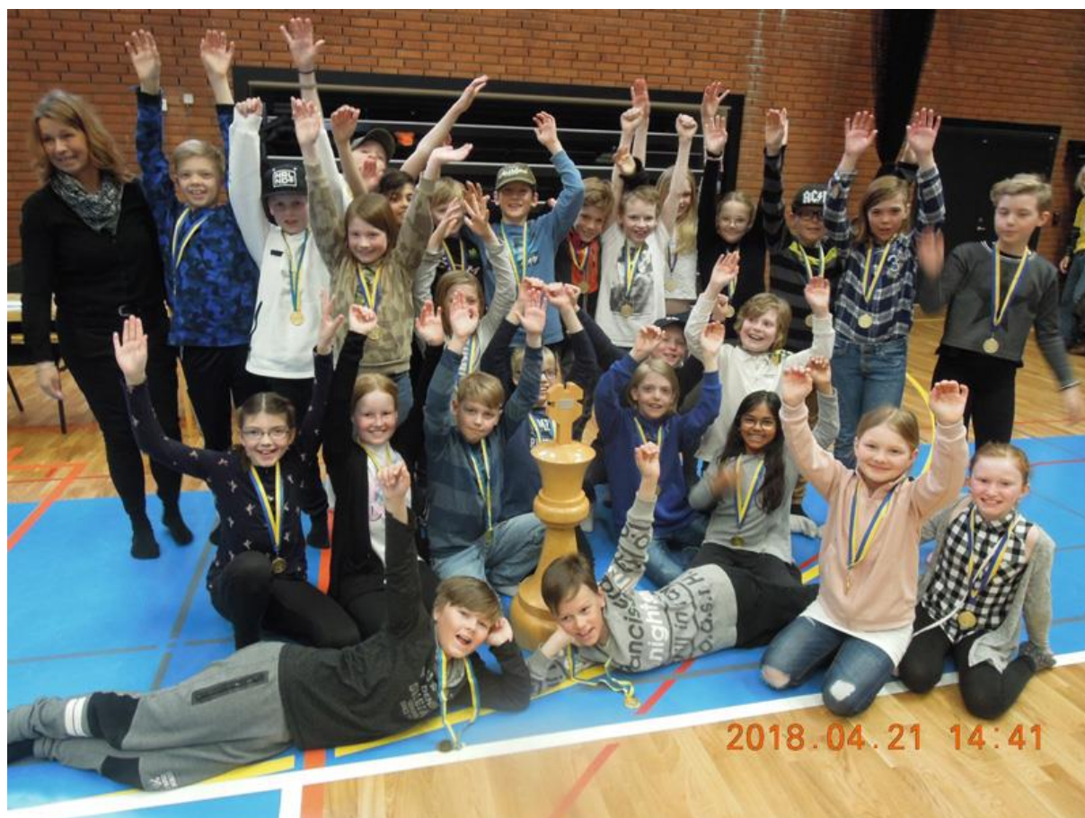
Segrande i Länskvalet av Schack4an: Sångshusvallens skola