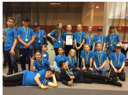
.....D:o men utan lärarinnan!