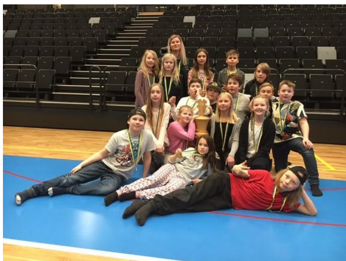
Lagfoto på vinnande Sånghusvallens skola, Krokoms kommun.

De fyra främsta lagen kvalificerade för riksfinalen i Västerås där Sånghusvallens skola kom på en hedrande fjärdeplats och Lillsjöskolan tog plats 13.