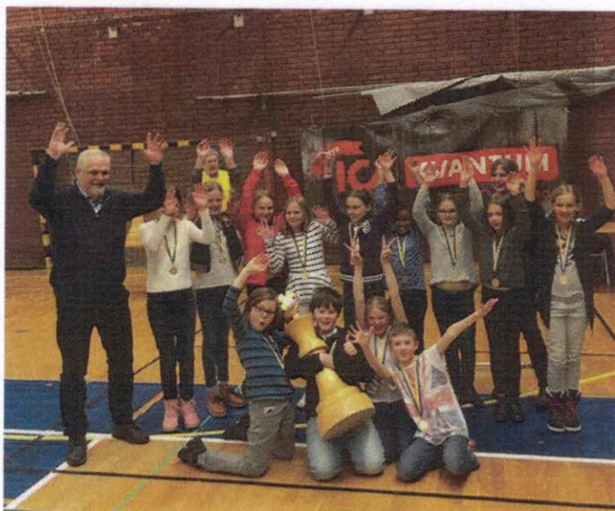
foto: vinnande Sonfjällsskolan, Hede

De fyra främsta lagen kvalificerade för riksfinalen i Västerås där Norra skolan kom på fjärde och Sonfjällsskolan på en hedrande femteplats (av 128 finallag).