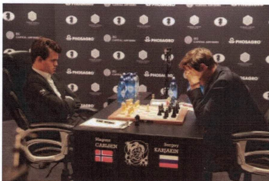
VM-kombattanterna Carlsen och Karjakin.